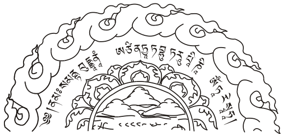
མི་གཉེན་ལྷ་ཉལ་ལྷ་ཉལ་པ་འདི་དཔེ་ཚའི་ནང་དུ་བཞག་ན་དཔེ་ཚད་ཅི་འདྲར་ བཞོམས་གུང་ཉེས་པ་མི་འབྱུང་བར་འཇམ་དཔལ་ཅུ་རྒྱུད་ལས་གསུངས་སོ།།

བསྟན་པའི་དཔལ་གྱུར་སྒྲ་མའི་ཞབས་པད་བརྟན། ། བསྟན་འཛིན་སྐྱེས་བྱས་ས་སྟེང་ཡོངས་ལ་བྱབ། ། བསྟན་པའི་སྐྱེན་བདག་མངའ་ཐང་འབྱོར་པ་རྒྱས། ། བསྟན་པ་ཡུན་རིང་གནས་པའི་བཀྲ་ཤིས་ཤོག །